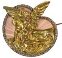
René Lalique, broche Sphinx, v 1893, or émail, diamants. Wingen-sur-Moden - Musée Lalique

Mardi 13 juin 2023, à 11h00 31 rue Danielle Casanova, 75001 Paris Métros : Opéra, Pyramides, Tuileries Nombre de participants - 15 Prix - 45€